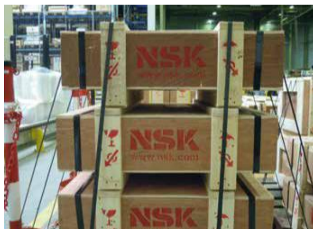
Caixas de madeira originais NSK

Caso tenha alguma dúvida sobre um produto NSK que você adquiriu, entre em contato com seu distribuidor local ou com a NSK diretamente pelo nosso site. Seu requerimento será redirecionado para a área responsável.