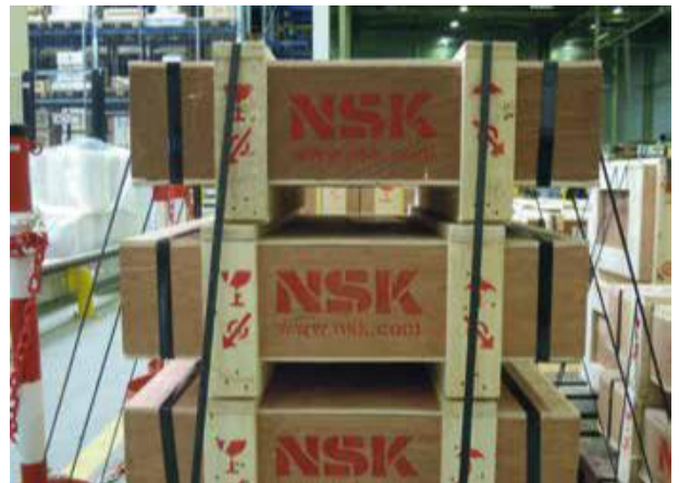
Cajas de madera originales NSK.

Caso tenga alguna duda sobre un producto NSK que usted adquirió, contacte a su distribuidor local o a NSK directamente a través de nuestro sitio. Su solicitud será encaminada al área responsable.